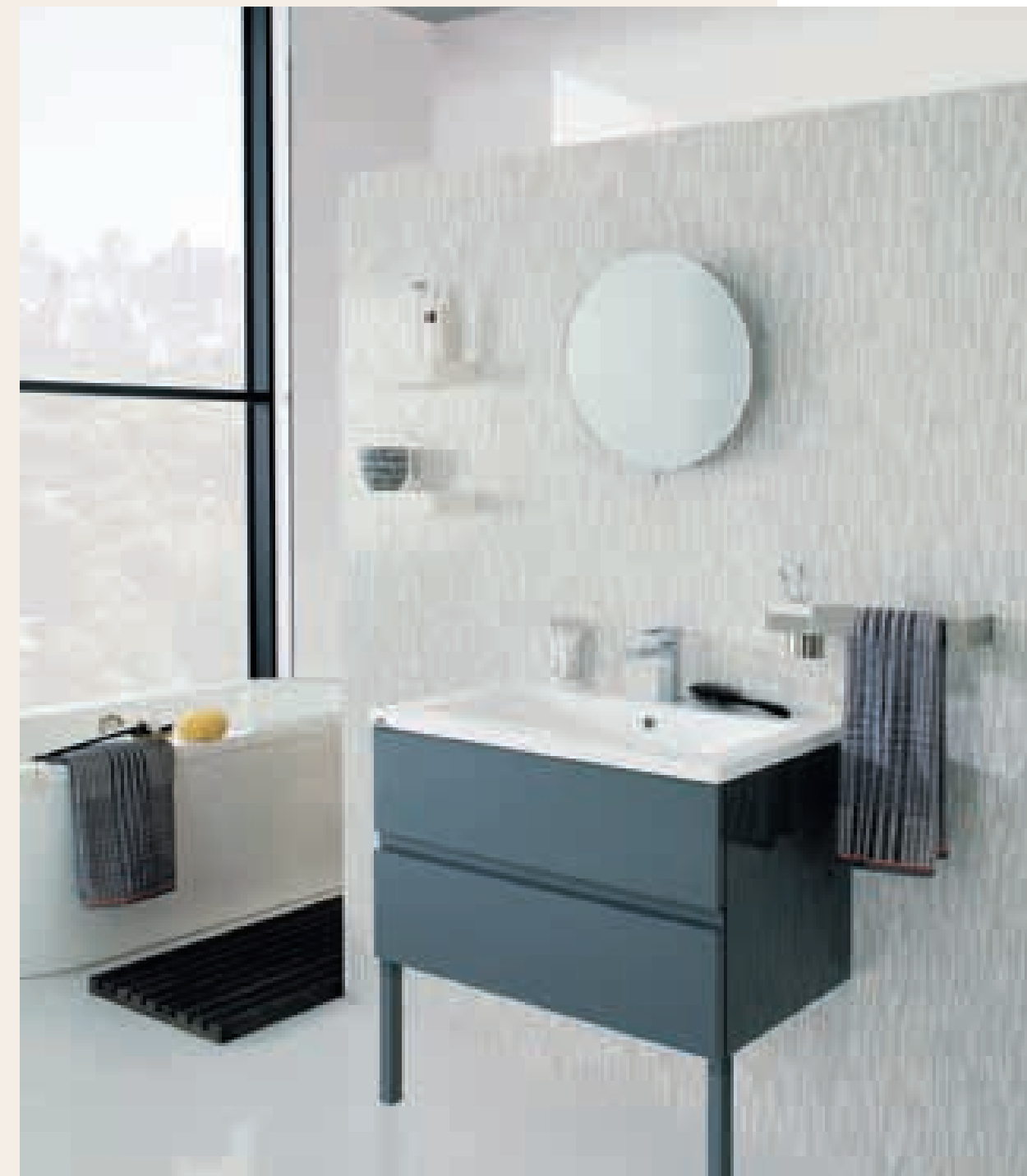
PHOTO D'AMBIANCE, MATÉRIAUX PORCELANOSA

GROHE PORCELANOSA CARRELAGE · SALLE DE BAINS · CUISINE