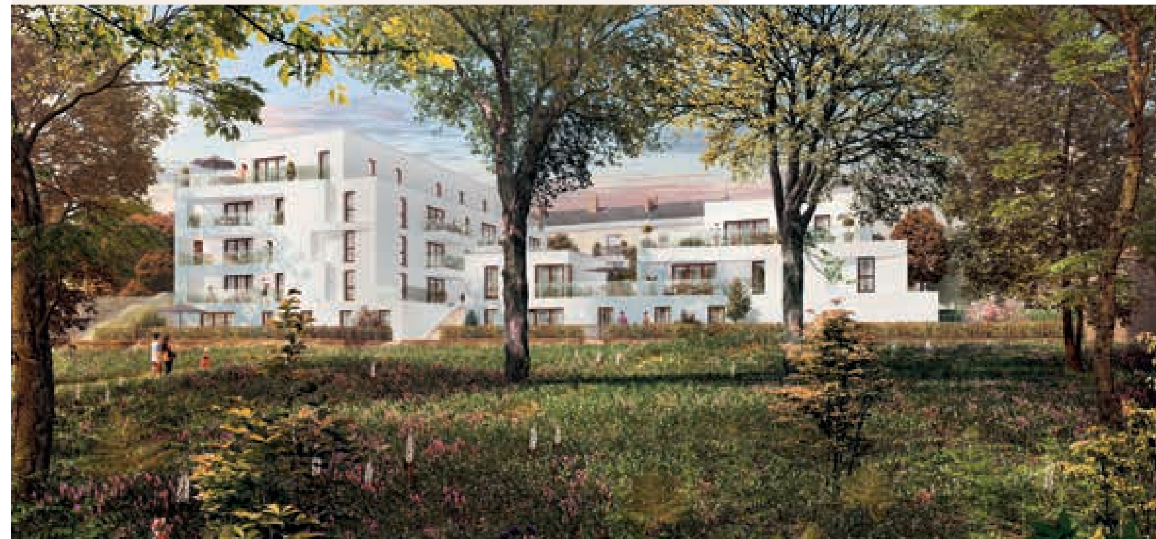
PHOTO D'AMBIANCE NON CONTRACTUELLE, ÉTUDE PAYSAGÈRE EN COURS D'ÉLABORATION