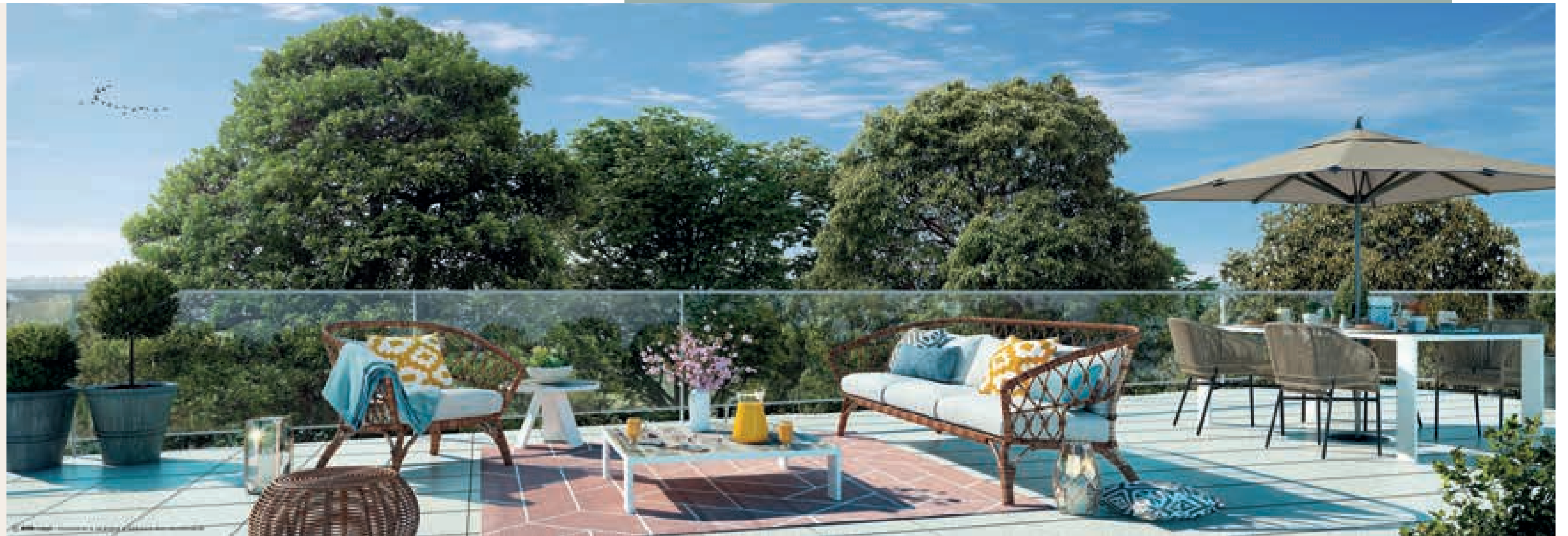
^ TERRASSE DE L'APPARTEMENT 3 PIÈCES B 102

Les appartements ont été conçus pour vous offrir un cadre de vie serein, agréable et en totale harmonie avec la nature.