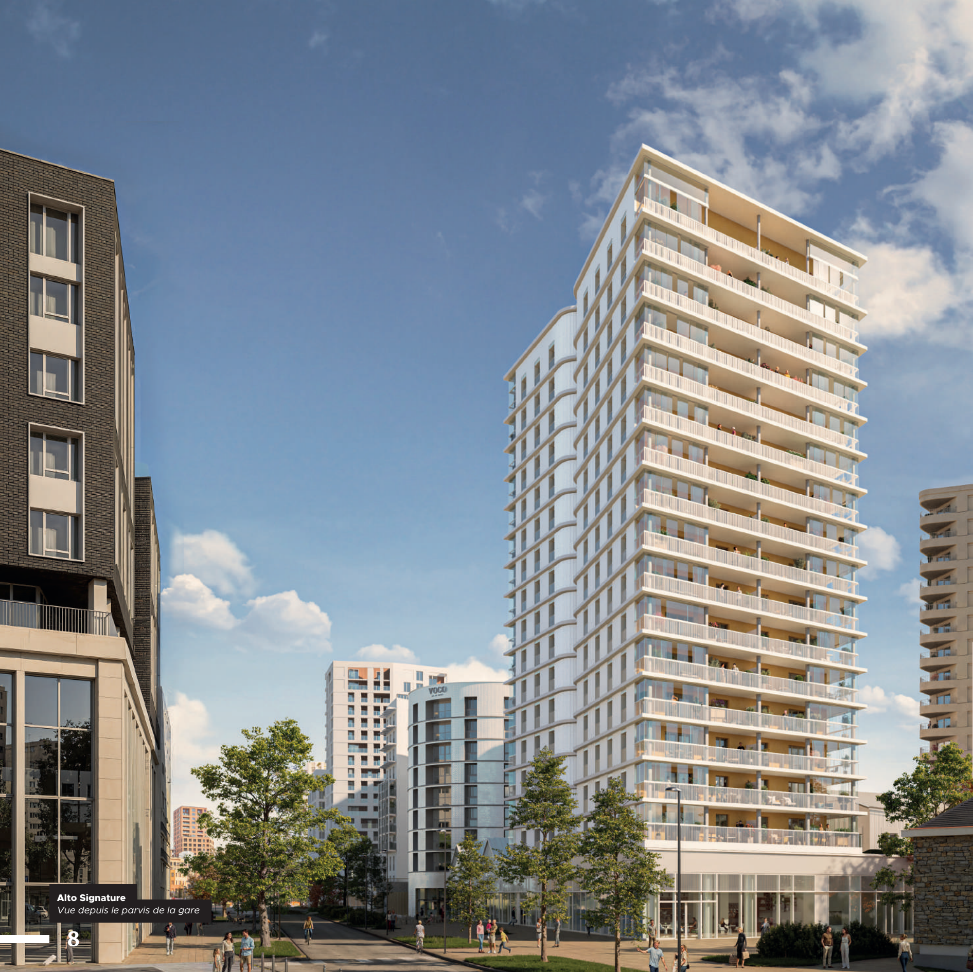
Alto Signature Vue depuis le parvis de la gare