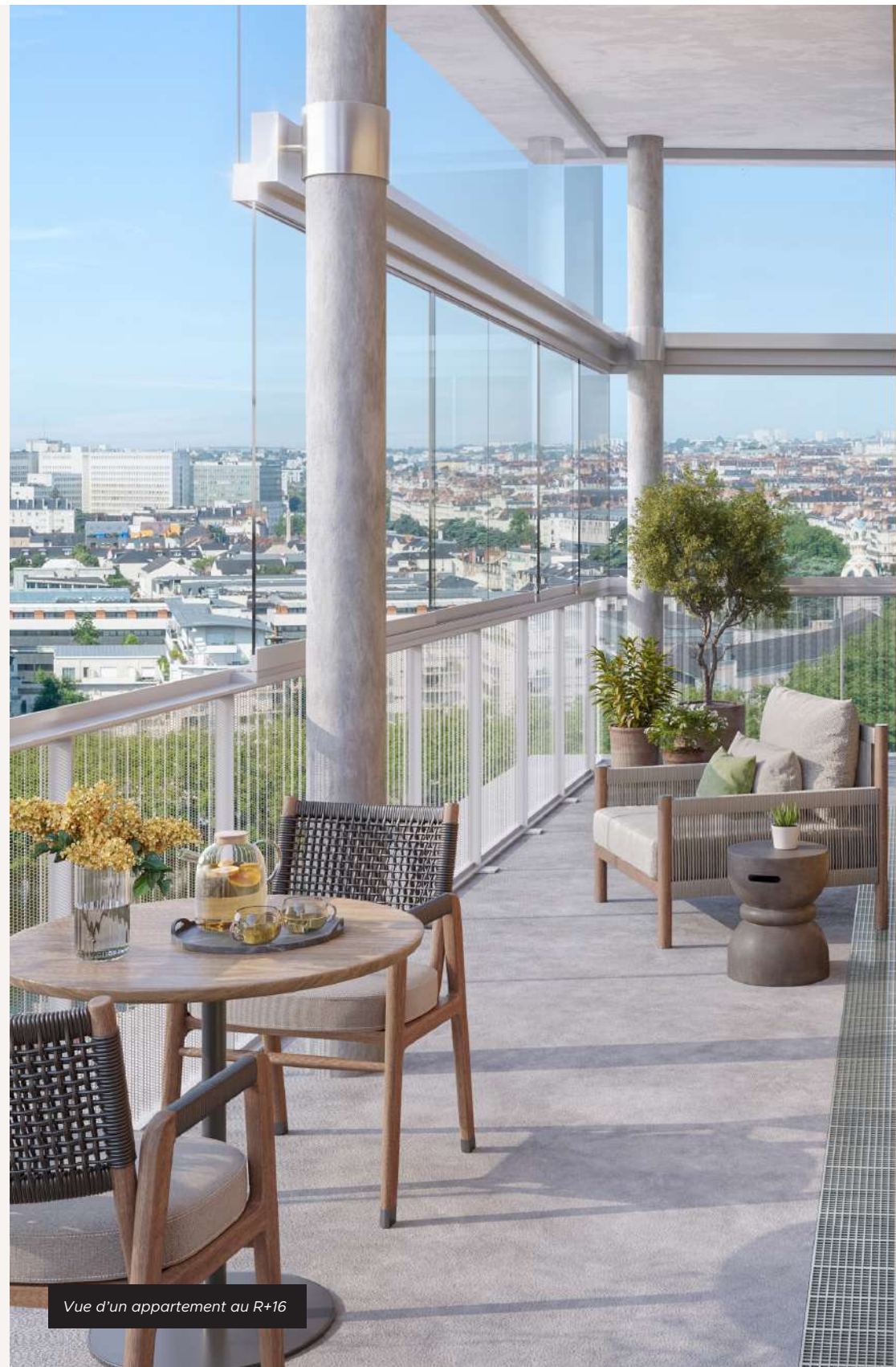
Vue d'un appartement au R+16

À partir du 10 e étage, les vues s'ouvrent largement jusqu'à l'Erdre et au canal Saint-Félix , offrant un panorama mêlant ville et nature , en constante évolution.