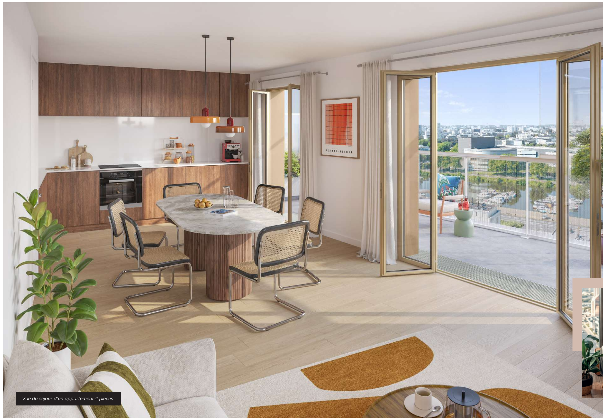
Vue du séjour d'un appartement 4 pièces